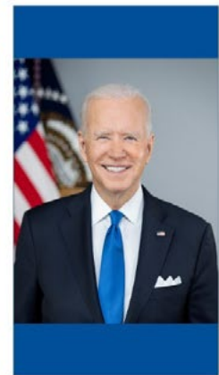
JOE BIDEN Coopération multilatérale Nouvelle Stratégie pour l'Afrique