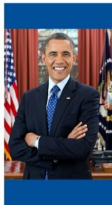
BARACK OBAMA Coopération énergétique Power Africa