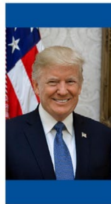
DONALD TRUMP Coopération commerciale et sécuritaire Prosper Africa