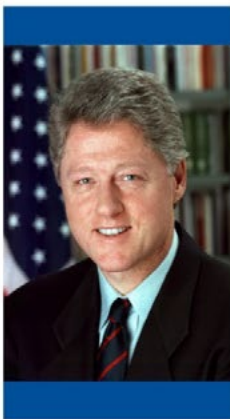
BILL CLINTON Coopération Commerciale AGOA