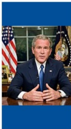
GEORGES W. BUSH Coopération militaire et Aide au développement AFRICOM - PEPFAR